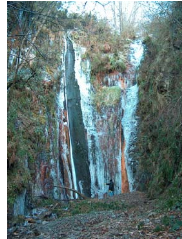
Cascada del Cachón de la Igualta (compárese con el observador: a su pie)

Los dos canales de época romana que discurren por la vertiente septentrional de los Montes Aquilianos con dirección a Las Médulas, pasan por Santa Lucía de Valdueza. El más alto, faldea por encima del pueblo a una cota media aproximada de 1.015 m snm y el canal bajo, pasa por debajo de Santa Lucía a una cota cercana a los 880 m snm.