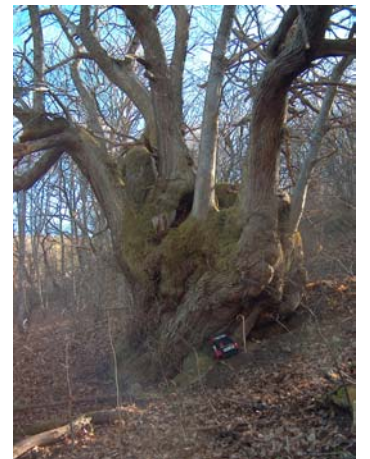
Castano del paraje de Valdeloso