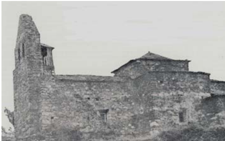
Aspecto de la iglesia de Santa Lucía en el verano de 1970.